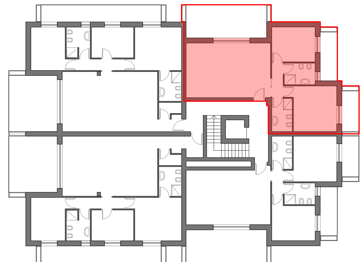
PIANO SECONDO scala 1:200